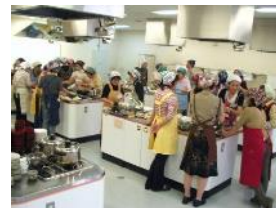
熱心に調理する参加者