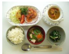
美味しそうな出来あがり

次回は今年3月下旬を予定しております。今回に引き続き多くの方に出席していただけますよう、皆様のご協力をお願い致します。