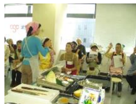
調理の前にメニューの説明